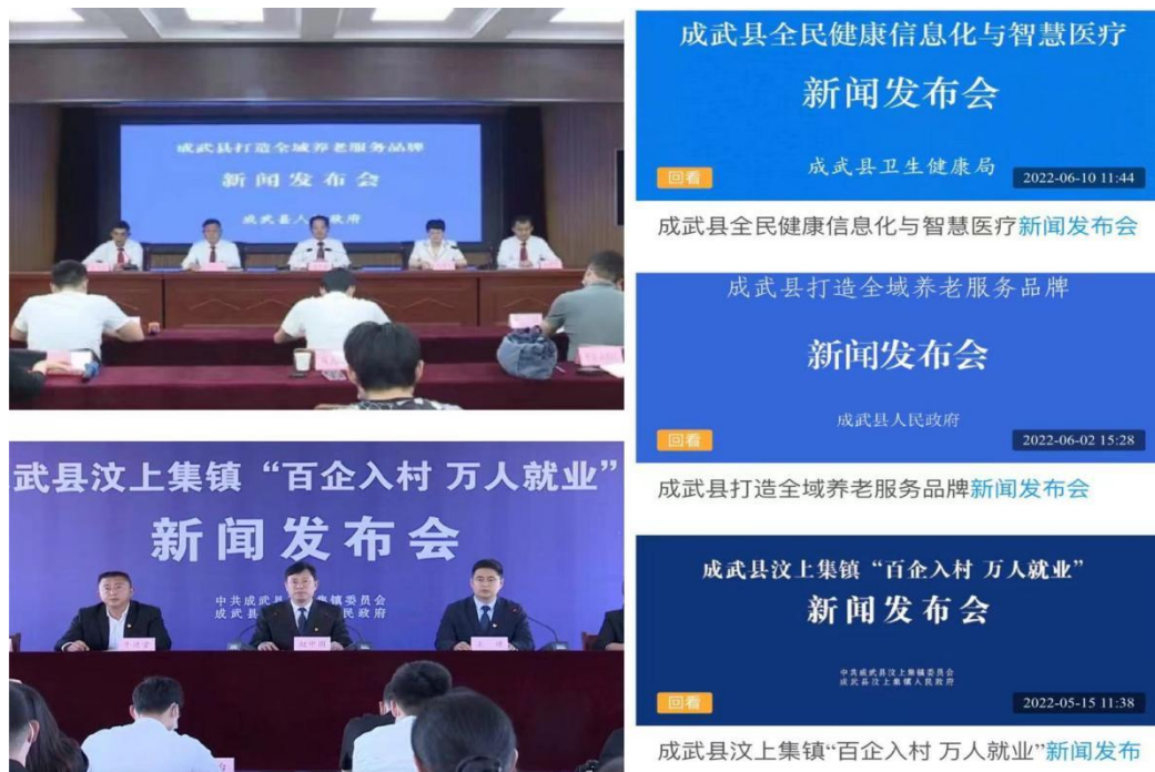
图 3：成武新闻发布会常态化

一是建立平台，提高信息发布水平。健全完善政策发布平台，对2016年以来的政策文件重新规整，可进行关键字和企业、个人分类检索，提高了政策主动推送的精准度。建立政策问答平台，可对政策相关问题进行智能查询，更加便民高效。二是健全机制，县级政府公开活动常态化。出台《成武县新闻发布工作实施方案》，完善新闻发布机制，选取群众关心关注的议题，推出“云端”新闻发布会，力促政府公开“晾晒”工作常态化。三是精益求精，科学构建政府信息公开目录。系统梳理政府网站政务公开栏目信息，做到布局合理、逻辑清晰、便于检索。四是注重规范，巩固提升试点领域标准化规范化建设。推动各领域公开内容与主动公开基本目录和重点领域信息公开目录的融合，确保发布的内容和要求的內容一致，公开的信息和群众关注的热点一致。