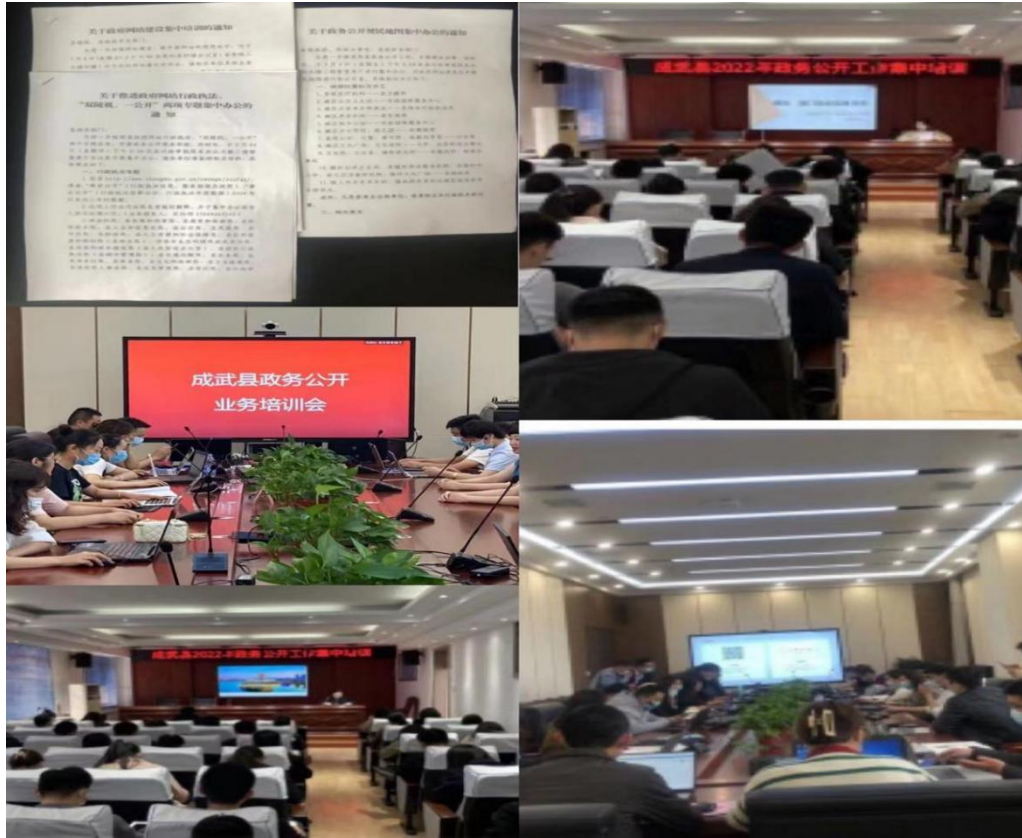
图 5：政务公开业务培训、集中办公常态化