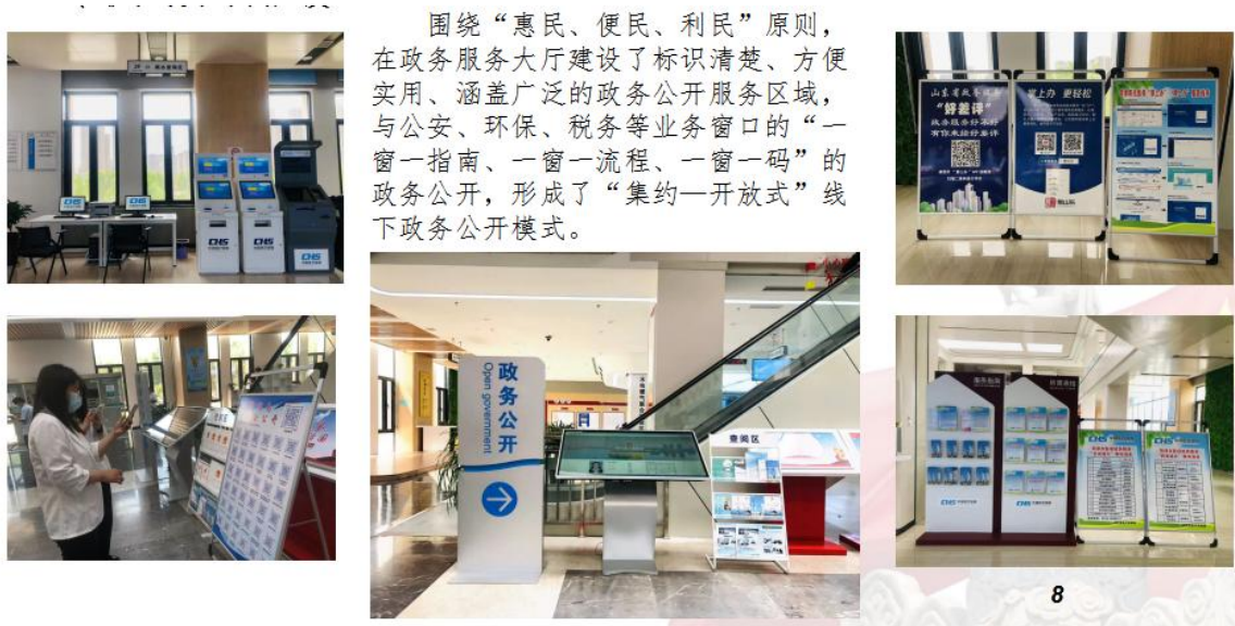
图 4：政务公开专区及其他政务服务便民公开点

一是优化线上平台。我们改版提升了政府网站。梳理出一级栏目 189 个，二级栏目 567 个，优化专题专栏 21 个，优化政策解读、便民服务、重点项目、政策集成等多项功能，网站功能更加饱满，窗口服务作用更加突出。二是打造线下平台。围绕“惠民、便民、利民”原则，依托政务服务大厅，建设了标识清楚、方便实用的政务公开专区。专区公开与部门的“一窗一指南、一窗一流程、一窗一码”的服务公开，构建了“集约—开放式”的线下政务公开模式，成为便民的政务公开阵地。三是创新县级政府公报公开方式。整合政府公报数字资源，探索在“两馆”、政务服务大厅等公共场所开展线下公开及免费赠阅活动，做到便民服务“零距离”。四是提升新媒体管理水平。严格落实省市关于规范政府系统新媒体管理方面的文件精神，提升政府和部门新媒体更新频率，提高信息发布质量和内容的原创性、丰富性。