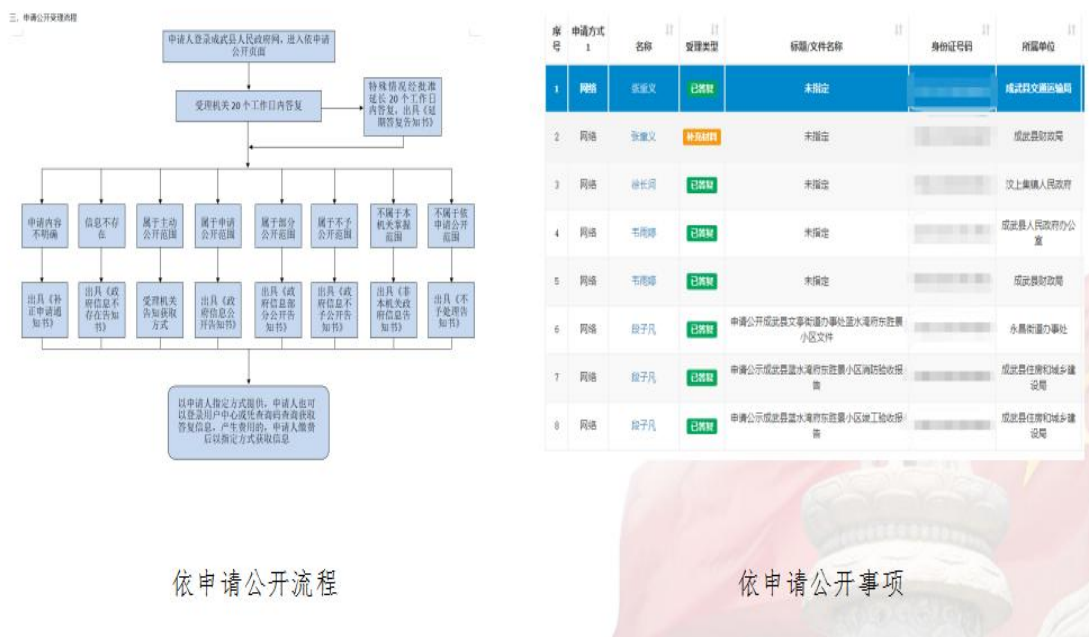
图 2：依申请公开办理流程及办理件

群众方便的原则，聘请第三方对依申请公开网上办理流程进行重组和优化，从接收到答复，所有的环节均简洁高效，网上依申请公开办理进一步规范。二是完善线下办理机制。基于依申请公开法治化、公开化要求，建立健全司法、政府办、职能部门三方会商机制，强化合法性审查，确保申请公开的答复立得住。三是注重群众满意。坚持群众导向、结果导向，围绕群众的所思所想所盼，加强同群众沟通，切实以公开提升群众满意度。2022年共办结依申请公开件47件，比2021年总体下降17.5%。从申请内容看，主要涉及土地征收、房屋拆迁、物业管理等方面。从申请答复看，“予以公开”42件，占89.3%；“部分公开”2件，占4.2%；“不予公开”0件，“无法提供”2件，占4.2%；“不予处理”1件，占2.1%。全县共办理政府信息公开行政复议2件，行政诉讼0件。